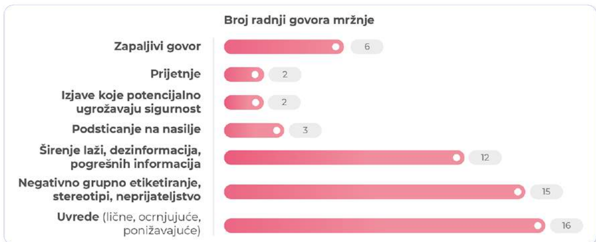
Grafikon 4: Broj radnji govora mržnje prema prijavljenim slučajevima

Kada je riječ o radnjama koje predstavljaju govor mržnje, najčešće su to uvrede (18 slučajeva) i negativno grupno etiketiranje, stereotipi te neprijateljstvo (15 slučajeva). Prisutno je, također, širenje laži, dezinformacija i pogrešnih informacija (12 slučajeva). Kao i u slučaju svih drugih osnova, govor mržnje rijetko sadrži samo jednu radnju i češće je kombinacija više radnji. Kada je riječ o rodno zasnovanom govoru mržnje, to je najčešće kombinacija negativnog grupnog etiketiranja, uvreda, širenja laži i zapaljivog govora. Prema rezultatima monitoringa, najmanje su zastupljene prijetnje i izjave koje potencijalno ugrožavaju sigurnost, a zloupotreba ličnih podataka u ovom obliku nije zabilježena.