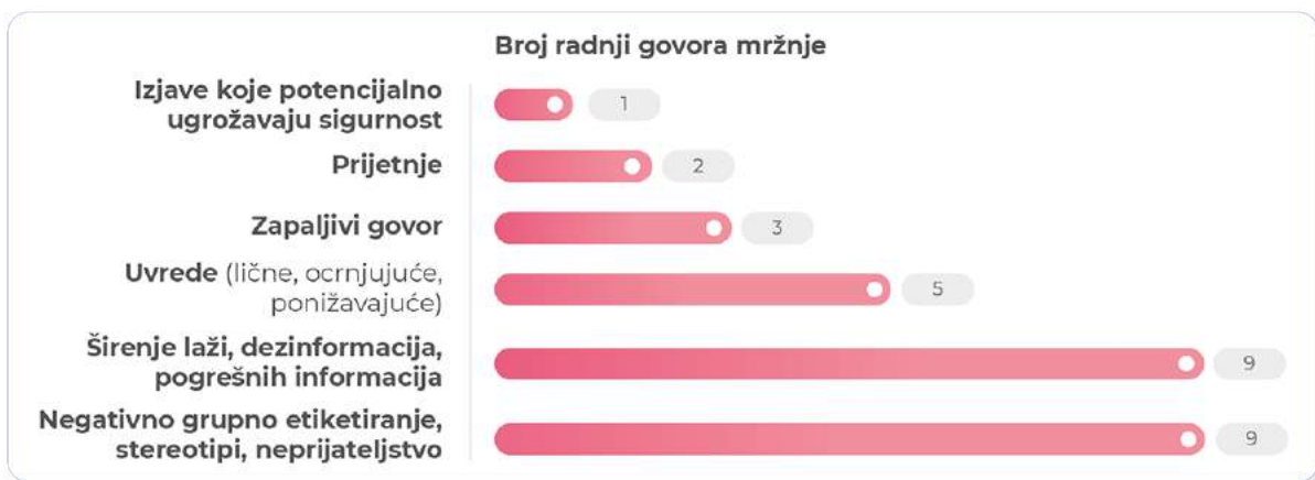
Grafikon 6: Broj radnji govora mržnje prema prijavljenim slučajevima

Najčešće radnje govora mržnje usmjerene protiv migranata su negativno grupno etiketiranje, stereotipi, neprijateljstvo i širenje laži, dezinformacija i pogrešnih informacija (9 od 12 slučajeva). Nisu zabilježeni slučajevi poticanja na nasilje i zloupotrebe ličnih podataka.