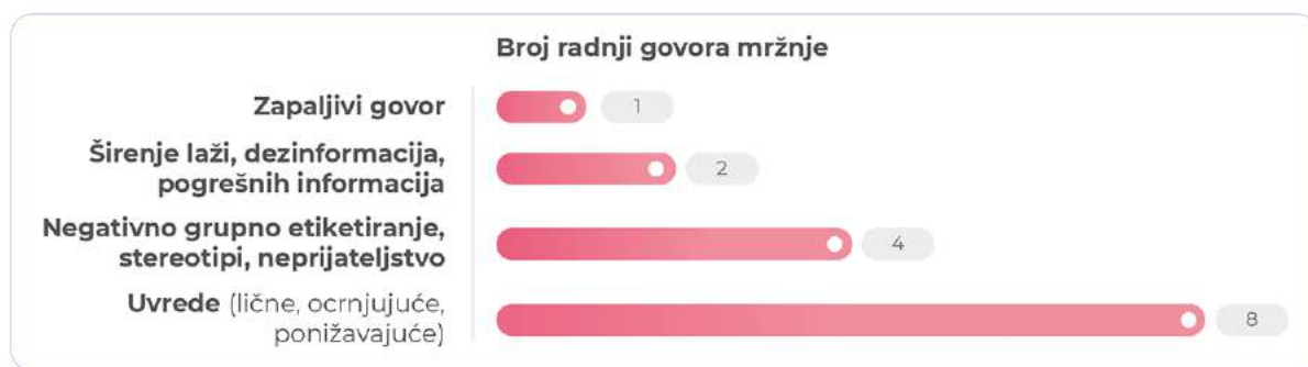
Grafikon 5: Broj radnji govora mržnje prema prijavljenim slučajevima

Značajan udio govora mržnje prema LGBTI osobama javlja se na internetu, naročito na društvenim mrežama. Ostavljanjem vakuma u pogledu govora mržnje na društvenim mrežama odobrava se jezik mržnje i poticanja na mržnju, što stvara plodno tlo za ovu vrstu radnji. U periodu monitoringa ovaj diskurs protiv LGBTI osoba promovisali su političari i internetski portali.