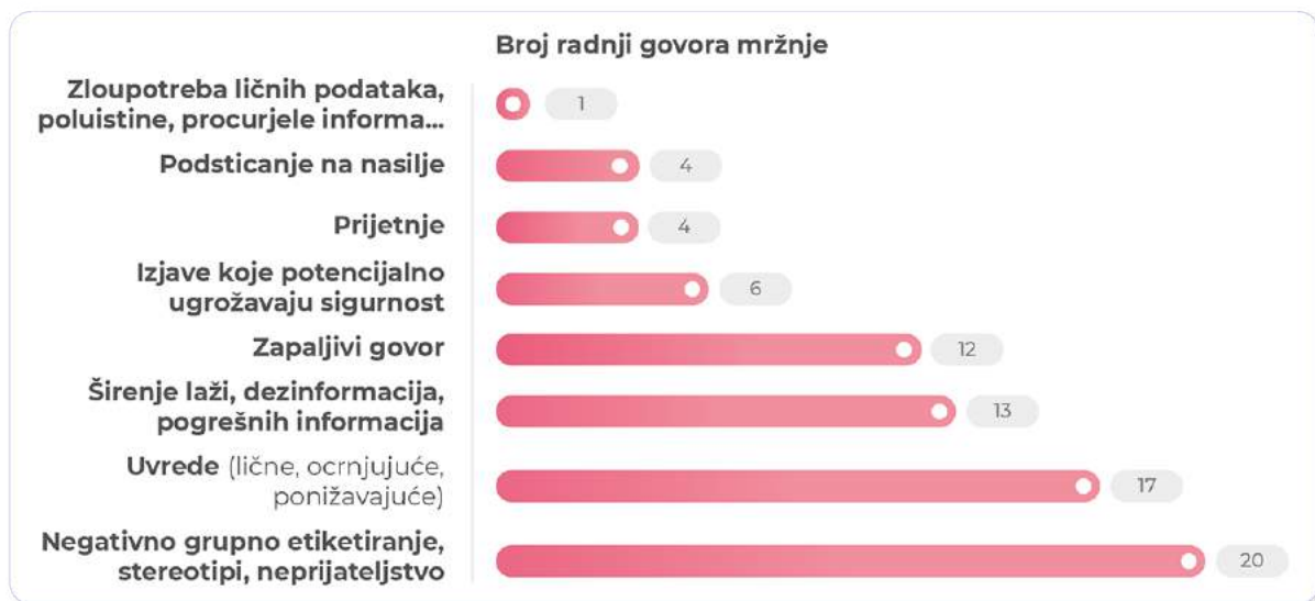
Grafikon 2: Broj radnji govora mržnje prema prijavljenim slučajevima

Oblici govora mržnje unutar ove etnički zasnovane kategorije uključuju sve praćene oblike: uvrede, prijetnje, negativno grupno etiketiranje, zatim širenje laži, dezinformacija, pogrešnih informacija i izjava koje potencijalno ugrožavaju sigurnost te poticanje na nasilje, huškački govor i zloupotrebu ličnih podataka. Ti različiti oblici govora mržnje (tj. vrste djela) najčešće su u kombinaciji jedni s drugim. Rijetko se bilježi samo jedan oblik govora mržnje u jednom slučaju. Dakle, popis oblika govora mržnje u jednom zabilježenom slučaju mnogo je veći od ukupnog broja slučajeva (sadržaja). Najčešći oblici govora mržnje, kada je riječ o govoru mržnje usmjerenom na etničku pripadnost ili kombinaciju etničke pripadnosti i migranata, su negativno grupno etiketiranje, stereotipiziranje i iskazivanje neprijateljstva (20 slučajeva) dok je zloupotreba ličnih podataka najmanje zastupljen oblik govora mržnje (1 slučaj).