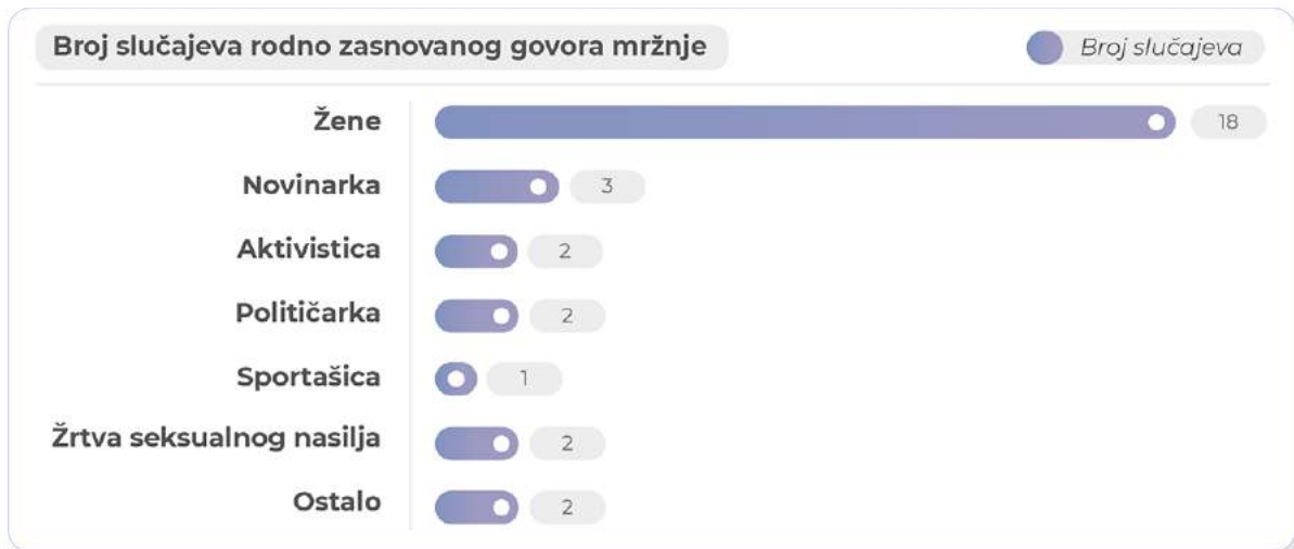
Grafikon 3: Broj slučajeva rodno zasnovanog govora mržnje usmjerenog prema pojedincima ili grupama

Kada je riječ o radnjama koje predstavljaju govor mržnje, najčešće su to uvrede (18 slučajeva) i negativno grupno etiketiranje, stereotipi te neprijateljstvo (15 slučajeva). Prisutno je, također, širenje laži, dezinformacija i pogrešnih informacija (12 slučajeva). Kao i u slučaju svih drugih osnova, govor mržnje rijetko sadrži samo jednu radnju i češće je kombinacija više radnji. Kada je riječ o rodno zasnovanom govoru mržnje, to je najčešće kombinacija negativnog grupnog etiketiranja, uvreda, širenja laži i zapaljivog govora. Prema rezultatima monitoringa, najmanje su zastupljene prijetnje i izjave koje potencijalno ugrožavaju sigurnost, a zloupotreba ličnih podataka u ovom obliku nije zabilježena.